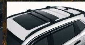
Roof Rail + Crossbar ชุดเสริมหลังคาตู้ + ชุดบรรทุกสัมภาระหลังคา