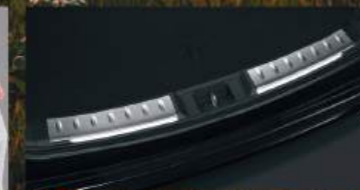
Cargo Step Garnish LED แผงครอบกันรอยขอบห้องสัมภาระ LED