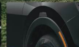
Wheel Arch Garnish คิ้วตกแต่งซุ้มล้อหน้า-หลัง