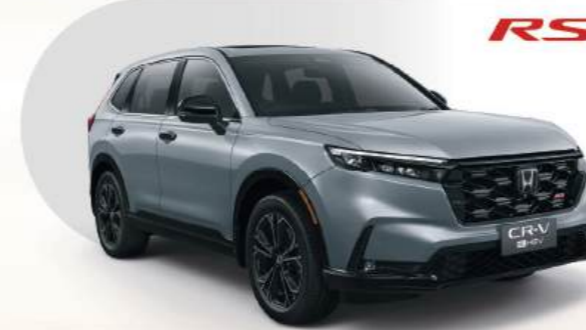
e:HEV RS 4WD