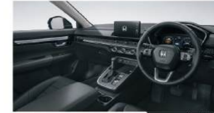
สีภายนอก ภายในสีดำ