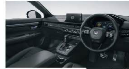
สีภายนอก ภายในสีดำ