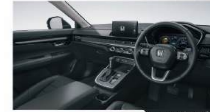
สีภายนอก ภายในสีดำ