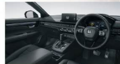
สีภายนอก ภายในสีดำ