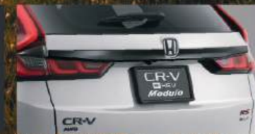
Black Package* แบล็กแพ็คเกจ*