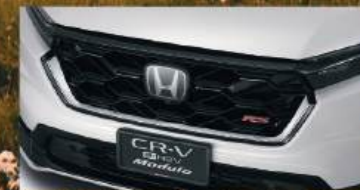
Front Grille Garnish คิ้วค้ำแต่งกระจังหน้า