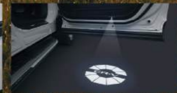
Pattern Projector ไฟส่องสว่างประตูหน้าแบบ LED