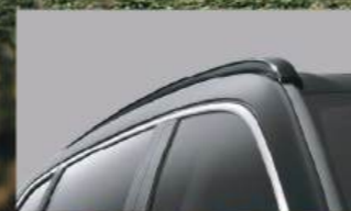
Roof Rail ชุดเสริมหลังคา