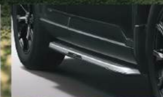
Running Board บันไดข้าง