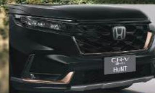
Front Garnish คิ้วตกแต่งกระจังหน้าและ ไฟตัดหมอก สี Glossy Copper พร้อมแผงใต้กันชนหน้า