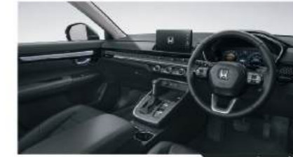
สีภายนอก ภายในสีดำ