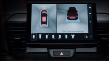
ระบบกล้องมองภาพรอบทิศทาง (MVCS)