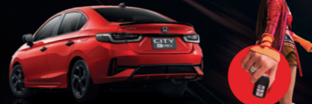
ระบบลือกรถอัตโนมัติ เมื่อคุณแฉกมืออยู่ห่างจากตัวรถ