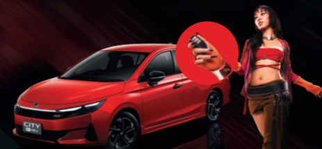
ระบบสตาร์ทเครื่องยนต์ พร้อมเครื่องปรับอากาศด้วยกุญแจรีโมท