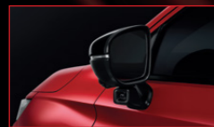
ระบบแสดงภาพมุมอับสายตา ขณะเปลี่ยนเลน (Honda LaneWatch)